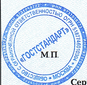
Схема сертификации: 1 с